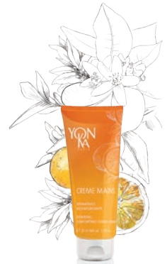
MANDARINE ORANGE DOUCE — VITALITÉ —