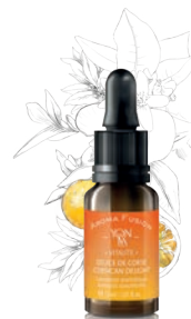
MANDARINE ORANGE DOUCE — VITALITÉ —