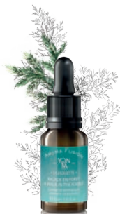
CÈDRE - CYPRÈS — SILHOUETTE —