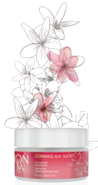
FLEUR DE TIARÉ - JASMIN — RELAX —