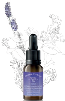
LAVANDE - HÉLICHRYSE — DETOX —

1 des 4 concentrés aromatiques à choisir avec votre esthéticienne.