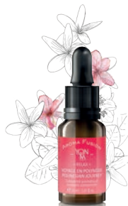
FLEUR DE TIARÉ - JASMIN — RELAX —