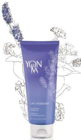
LAVANDE - HÉLICHRYSE — DETOX —