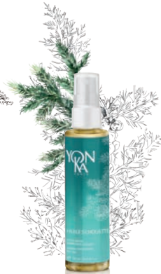
CÈDRE - CYPRÈS — SILHOUETTE —